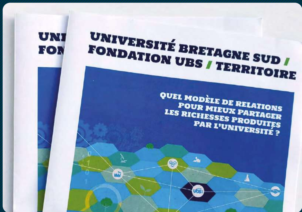
Synthèse de l'atelier « Quel modèle de relations pour mieux partager les richesses produites par l'université ? » Janvier 2021