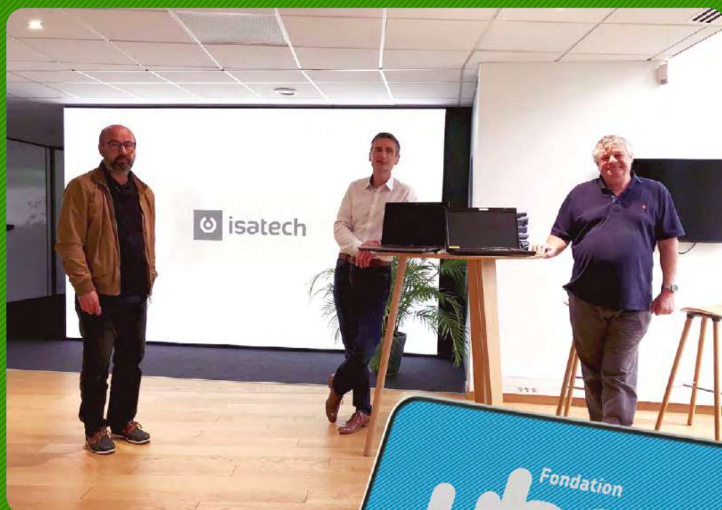
Appel à solidarité Covid 19 - dons d'ordinateurs