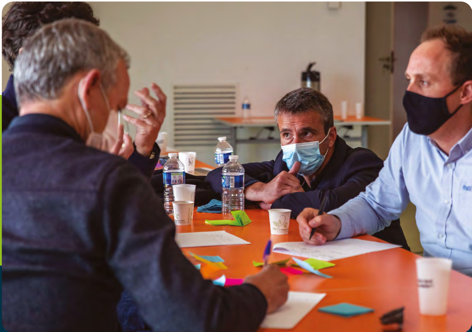
Travail collaboratif des commissions de la fondation sur le projet 2021/2025