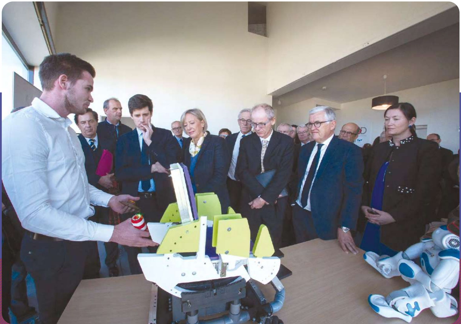
Inauguration chaire Maintien@Domicile