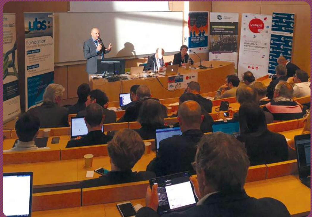
Séminaire « Quand la parole client devient data » Chaire Données/Connaissance Client