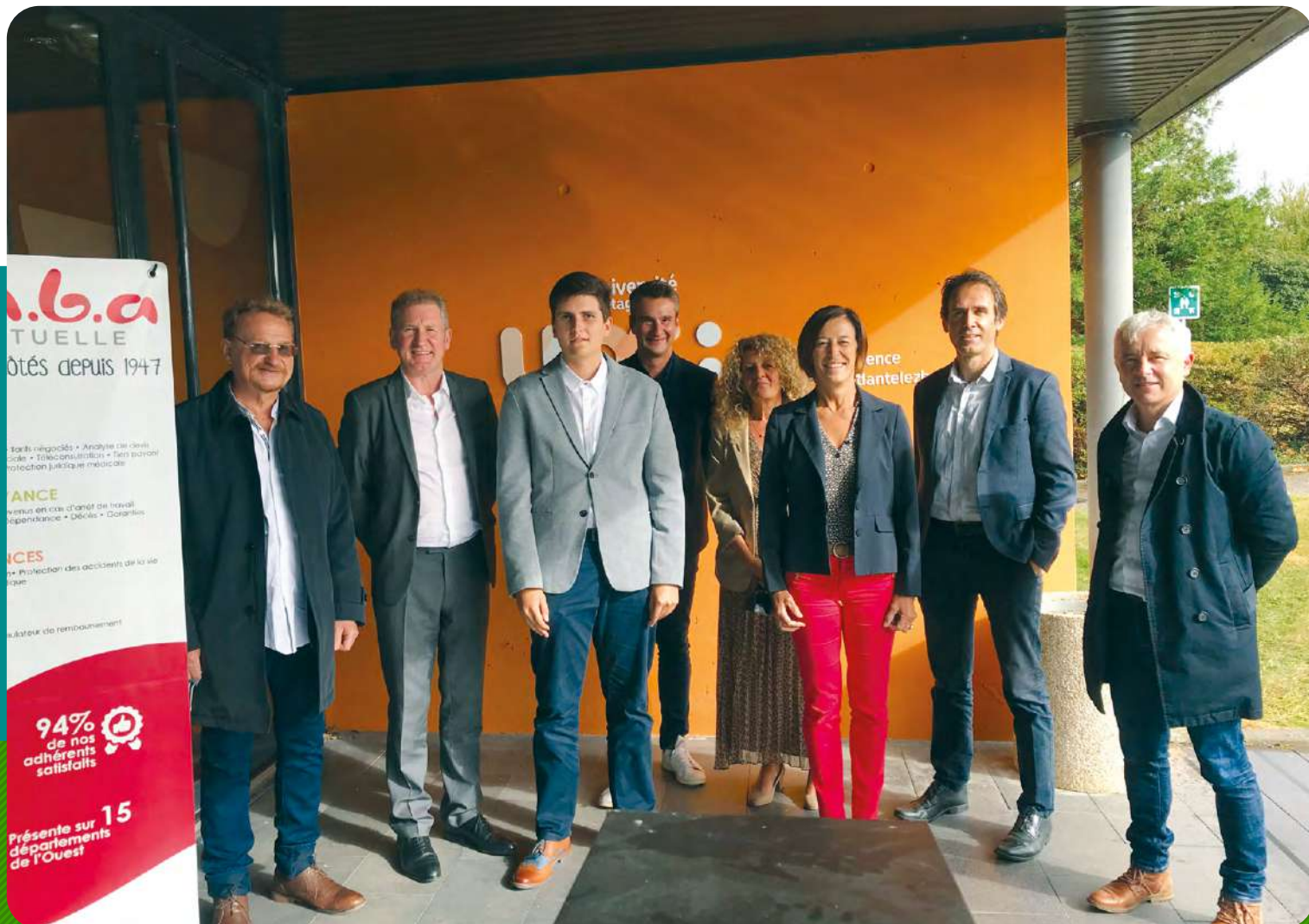
Attribution de bourses « entrepreneuriat étudiant »