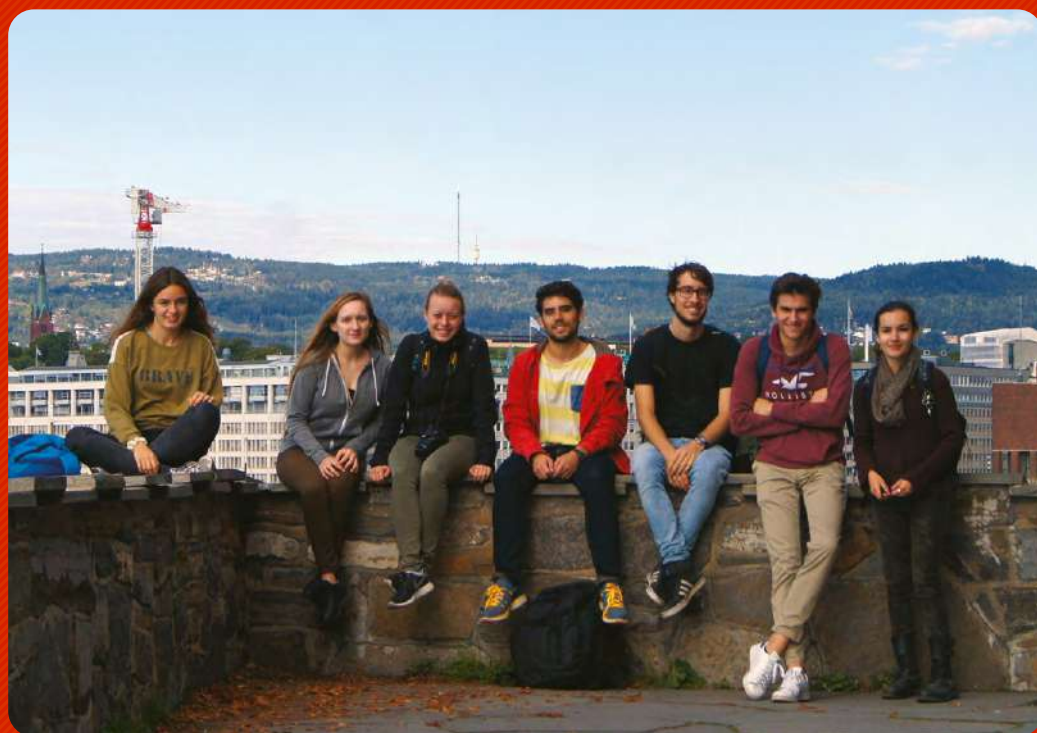
Attribution de bourses de mobilité internationale